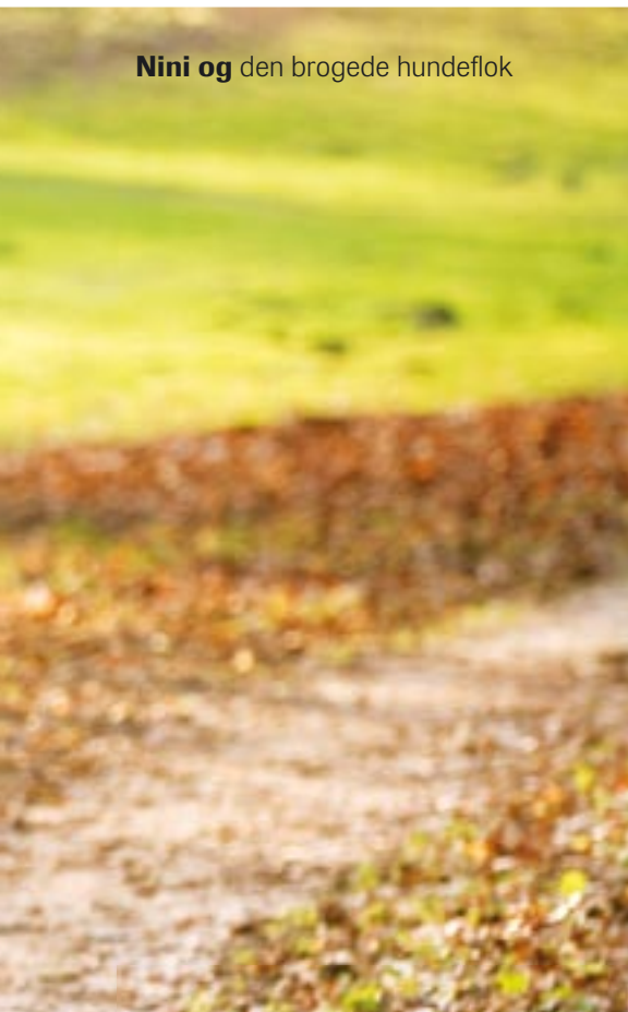
Nini og den brogede hundeflok